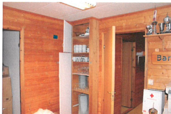
Møterommet før oppussingen.

Det ble lagt ned ca.150 timer med dugnadsarbeid i siste delen av oppussingen.