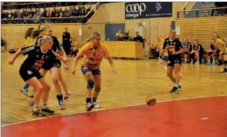
Fra kampen mellom OIF K02 og Utleira 25. november.

OIF Håndball er glad for støtten, og oppfordrer alle om å fortsette og møte opp på kamper der OIF-lagene er involvert. Ta med ett søsken, en onkel, ei tante eller ei bestemor og møt opp!!