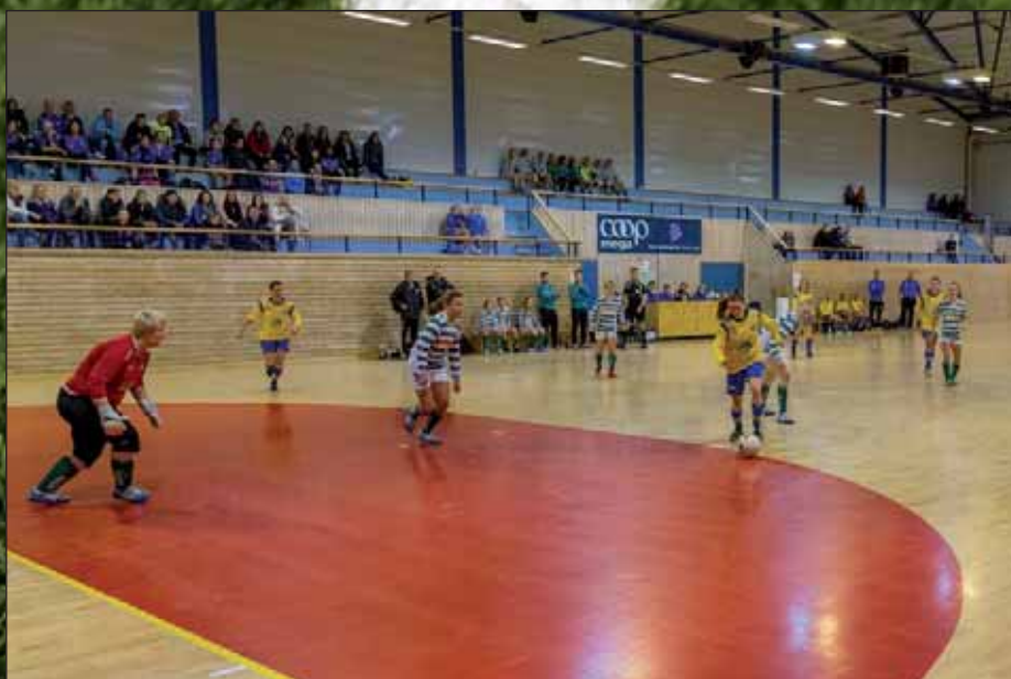
Fotball arrangerer Kløver Cup lørdag 23. januar

OIF Fotball er avhengig av et godt samarbeid med OIF Anlegg gjennom sesongen. Dette er frivillige som bruker fritiden sin på å legge alt til rette slik at vi har flotte spilleflater å boltre oss på både i trening og kamp. Det er en stor jobb som legges ned av disse frivillige, og fotballavdelinga er avhengige av den store og viktige jobben som blir gjort av denne gjengen.