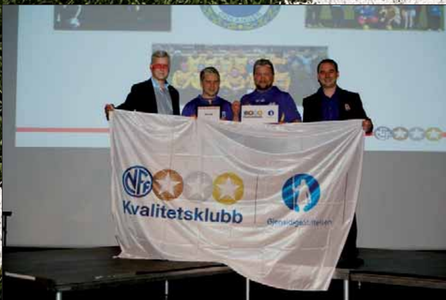
Fokus på blant annet trenerutdanning gjør OIF til en kvalitetsklubb

På herresiden begynner trenerkabalene å gå opp. Flere nye spillere har meldt overgang til OIF, de fleste av disse har spilt på et høyere nivå i seriesystemet enn der OIF er i dag, og målet for neste sesong er opprykk til fjerdedivisjon. Det finnes ingen garantier i fotball, men stallen til neste sesong med nye og gamle spillere ser veldig bra ut, så får vi håpe på at vi kan feire opprykk neste høst i Idrettsparken.